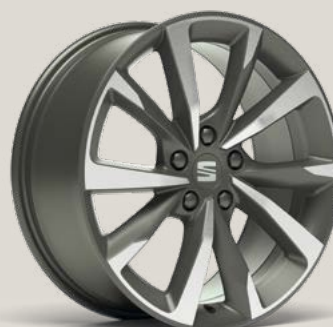
Performance FR PUK