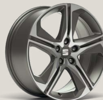
Performance 2 FR PUN