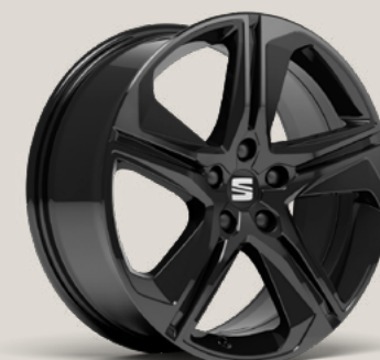
Performance Black Pack FR C2K