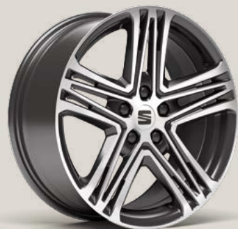
Performance FR PUM